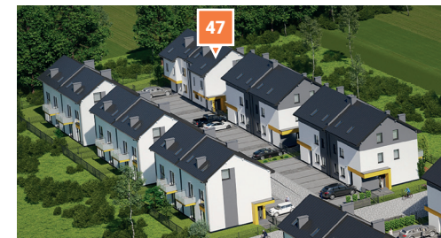
Widok osiedla z lotu ptaka